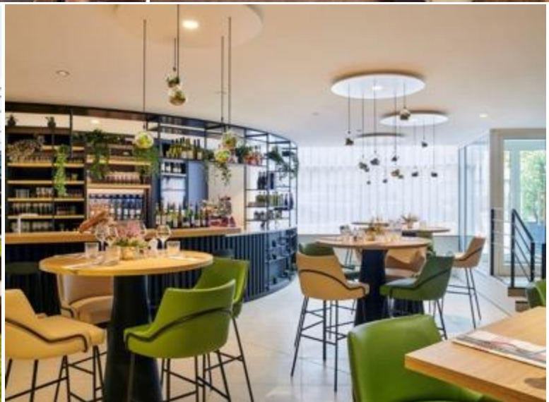
พักที่ Hôtel Mercure Paris La Défense หรือเทียบเท่าระดับ 4 ดาว (2 คืน)